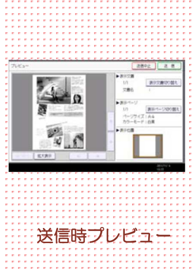
送信時プレビュー