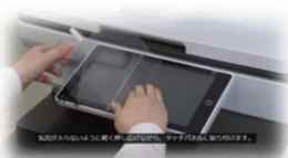
抗菌フィルム貼付手順動画